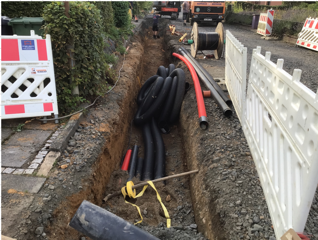
Die Richtigkeit des Entwerfer / Ausführungs Bestatigt.