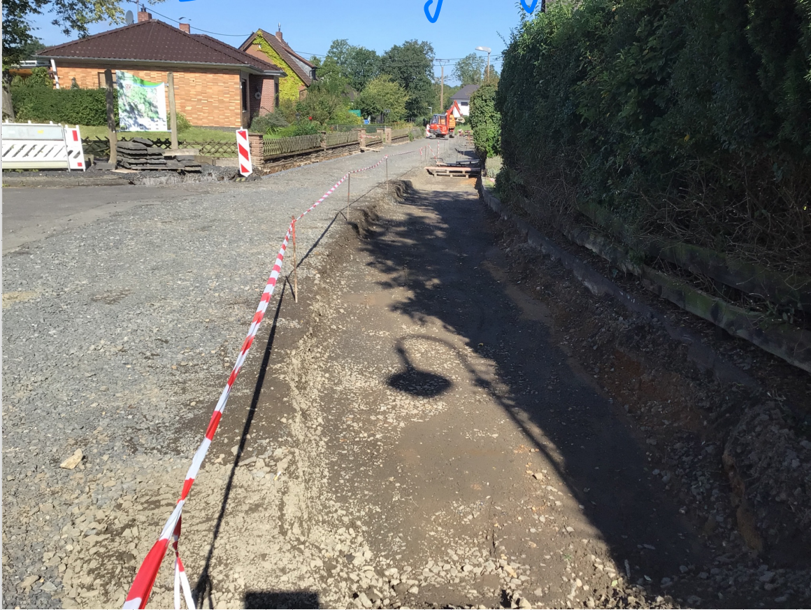
Auskoffungsarbeiten Kanunnug Grabenstr.

INGENIEURGRUPPE STEEN-MEYERS-SCHMIDDEM BERATENDE INGENIERE PARTG MBB